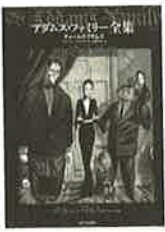
『アダムス・ファミリー全集』 チャールズ・アダムス、H・クヴィン・ミゼロツキ編 (Charles Addams: the Addams Family: an Evolution, '10) 安原和見訳/2,310円/河出書房新社

この紀行は「今」を反映して、アメリカの原子力核爆弾実験の検証から始まり、実験地に近いモニュメント・バレー行き、その後者は紀田さんのホームグラウンド、奇妙幻想文学のエッセイをまとめたもの。この分野は一九六〇年代後半から七〇年代にかけて起こった怪奇幻想ものの復刻ブームで、ジャンルとしての位置がきちんと定まったように思う。紀田さんはこの頃からアンソロジーや解題担当者として、僕たちの蒙を啓いてくれていて、その当時の文章がたくさん収められている。あの頃、貪るように読んだものも多くあって、時代の熱気が伝わってくるようだ。