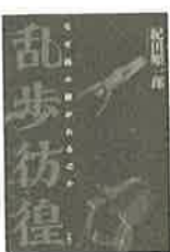
『乱歩彷徨 なぜ読み継がれるのか』 紀田順一郎/2,000円/春風社

して小鷹さんを決定的にアメリカマニアにした西部劇の話に移行する。そこからブルマガジン、メンズマガジンの生熊史、そしてフォークナー、ハメット、クラムリーと彼が愛する作家の聖地巡礼に発展する。