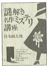
『謎解き名作ミステリ講座』 佳多山大地/1,785円/講談社